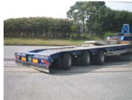
トラクターと同じ軌跡でトレーラーが通過できる