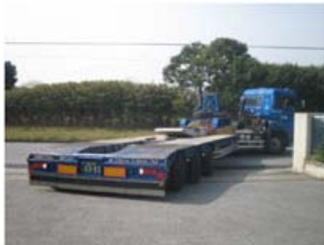
トレーラーのタイヤがトラクタと連動してかじをきる

A=B=6,300mmで搬入可能 隅切りがあればA=B=5,500mmでも搬入可能