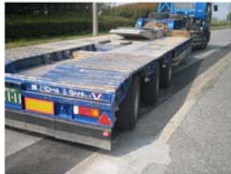
強制的にリモコンでタイヤを曲げることが可能