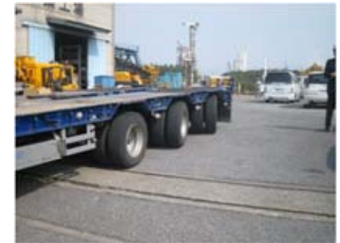
角軸が独立して角度を変えられる